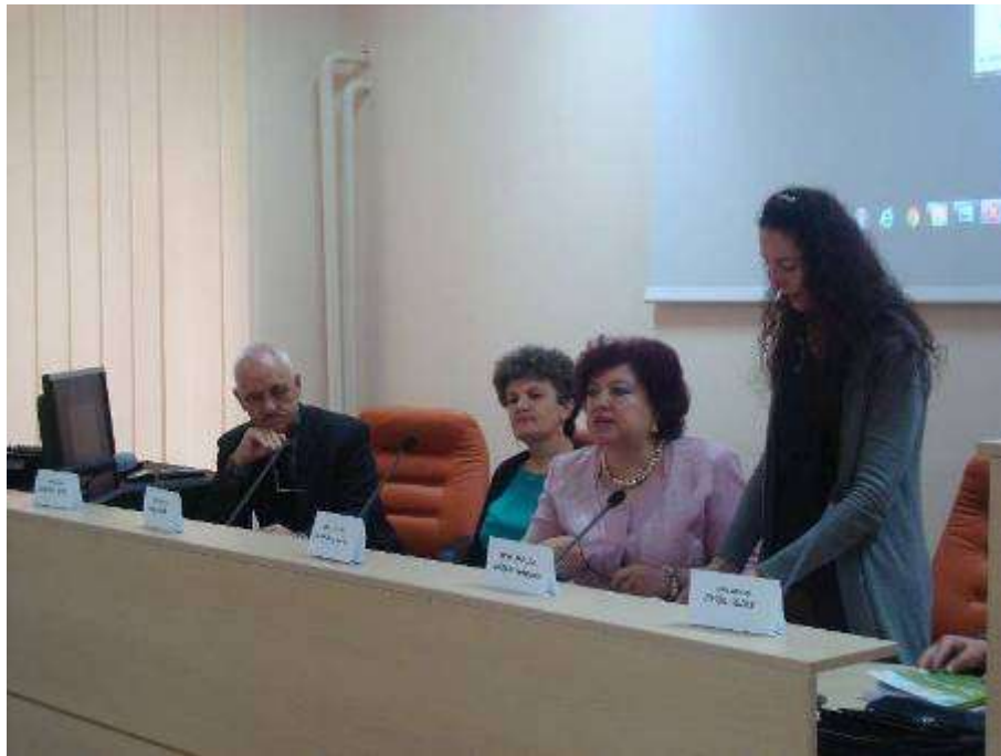
Στιγμιότυπο κατά τη διάρκεια της εισήγησης