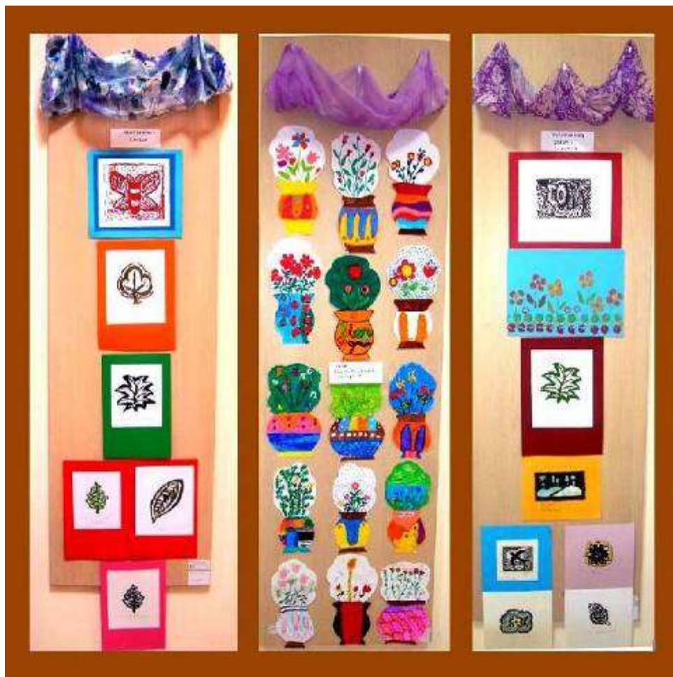
Η έκθεση των έργων των μαθητών