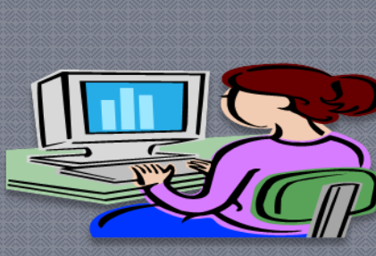
Καταγραφή δεδομένων, αναγκών