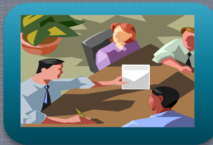
Δημιουργία Δικτύου τοπικά