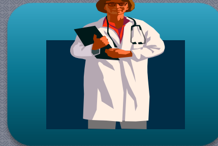
Πρωτοβάθμια παροχή υπηρεσιών Υγείας