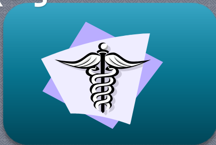
Επιτήρηση Δημόσιας Υγείας